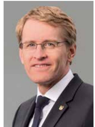
Ministerpräsident Daniel Günther

Entlang dieser Strategie werden wir als Landesregierung die Umsetzung der festgehaltenen Ziele und Maßnahmen in den kommenden Jahren forcieren. Mit dem übergreifenden Ansatz der Strategie wollen wir Schleswig-Holsteinerinnen und Schleswig-Holsteiner aller Altersgruppen gleichermaßen erreichen. Wir wollen die Menschen in ihrem kritischen Bewusstsein, ihrer Kreativität und ihrem Gestaltungswillen stärken und so darin unterstützen, Verantwortung für nachfolgende Generationen zu übernehmen. Mit der Umsetzung der Strategie tragen wir dazu bei, dass wir die Ziele der Agenda 2030 gemeinsam erreichen. Davon profitiert unsere Bildungslandschaft und wir fördern damit die nachhaltige Entwicklung Schleswig-Holsteins im Sinne der UN-Agenda 2030.