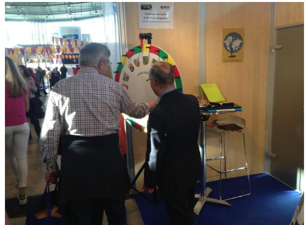
Besucher/-innen nehmen an den Mitmachaktionen teil und informieren sich über die Entwicklungspolitik der Länder.

Weitere Informationen zu den Aktivitäten der Länder im Bereich Entwicklungspolitik und der entwicklungspolitischen Bildungs- und Informationsarbeit finden Sie auf dem Portal Deutsche Länder in der Entwicklungspolitik: www.entwicklungspolitik-deutsche-laender.de .